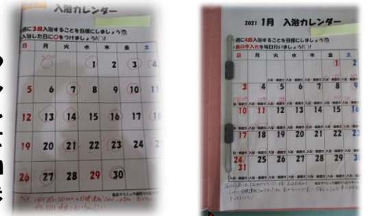
開始当初 → 現在

・Aさん 目標:「 自宅で入浴を週3回以上する! 」 入浴カレンダーを使用して、自宅で入浴をした日に○を付けてもらうように声かけから始めました。始めたころは週2～3回ほどの入浴でした。今では週5回以上の入浴が定着しており、毎回利用時に入浴カレンダーを持参してスタッフと一緒に自宅での入浴状況の確認を行っています。「 目標達成!! 」入浴が習慣になってきたので新たに目標を追加して取り組まれています。今後も目標達成できるように支援していきます。