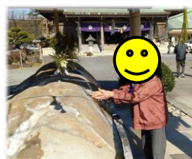
今年はお参り前に手を清めに行きました!!