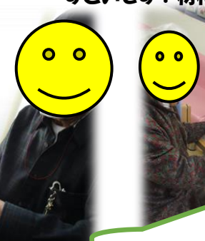
2人で協力して作り上げます