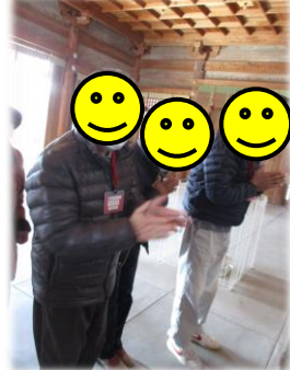
みんなそれぞれお参りをしました