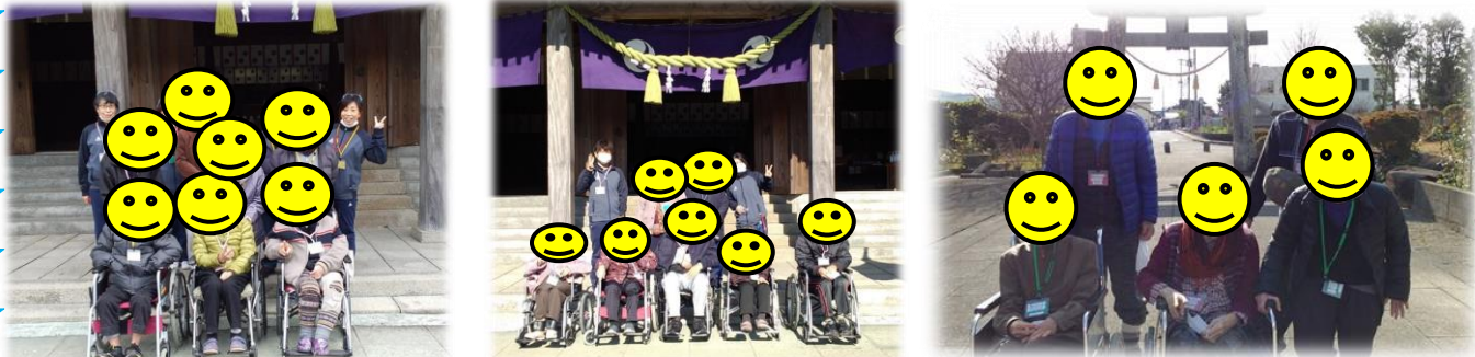
記念写真も忘れずに!! みんなでハイチーズ📷今年一年もよろしくお祈りします。

緊急事態宣言中ではありましたが、感染対策に気を付けて1月18日～22日にかけて八幡神社に初詣へ行ってきました♪今年も八幡神社→陣内阿蘇神社→諏訪神社までドライブ🚗三社参りをしてきました😊「昔はここには土俵があったもんね」「ここは昔お祭りがあって」「初めて来た」「ずいぶん久しぶりに来た」など車内の会話もはずみました。家内安全、元気でデイケアに通えますように、新型コロナが終息しますようになど神様にたくさんお願いしてきました！