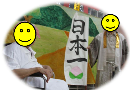
「桃太郎」撮影の一コマ

高岡院長より挨拶♪節目の年を迎えられた方へ感謝状を送りました。いつまでもお元気で！インタビュー中！