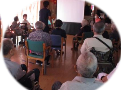
「桃太郎」の上映会、出演していたみなさまご協力ありがとうございました。とても楽しい時間を皆さんと過ごしました。

玉入れを2チームに分かれて行いました。ボールも風船・カラーボール・卓球ボールなど感触が違うボールを投げました。白熱し盛り上がりしました！